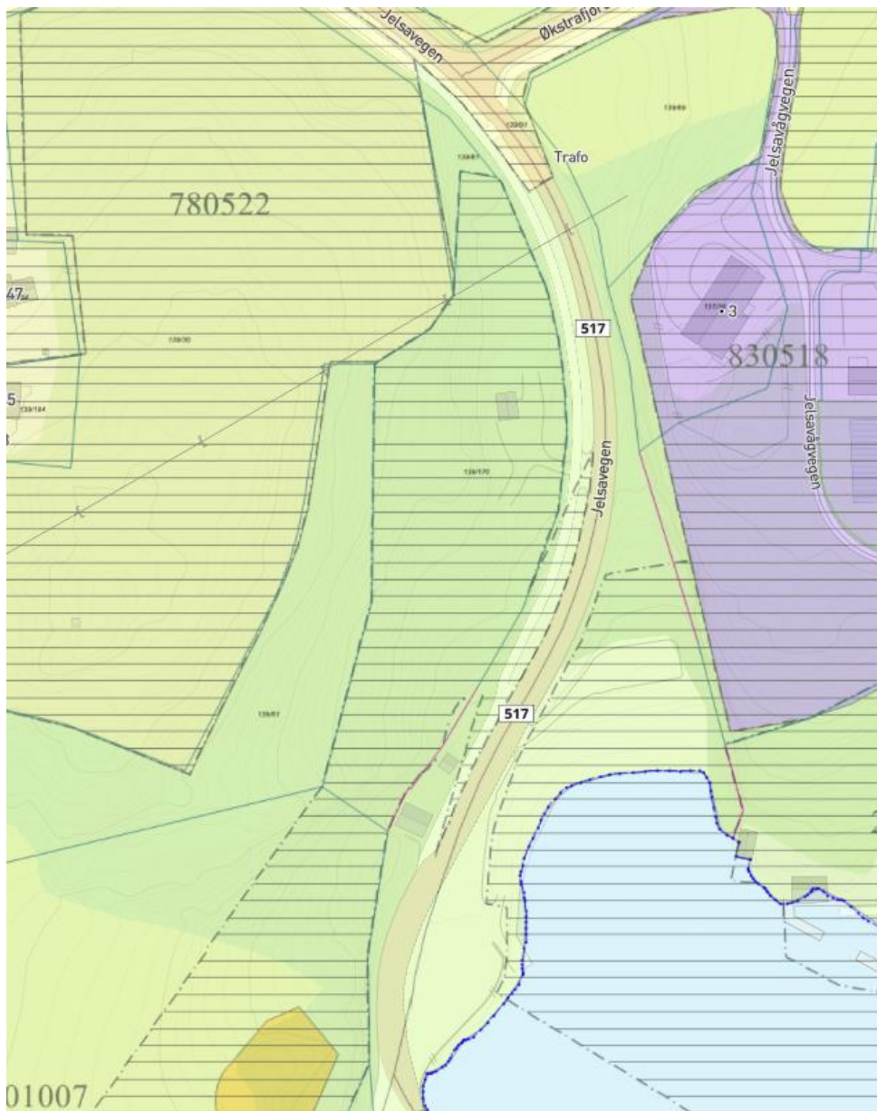
Utsnitt frå gjeldande kommuneplan for Suldal 2015-2024, der området er omfatta av omsynssone der gjeldande reguleringsplan skal gjelde