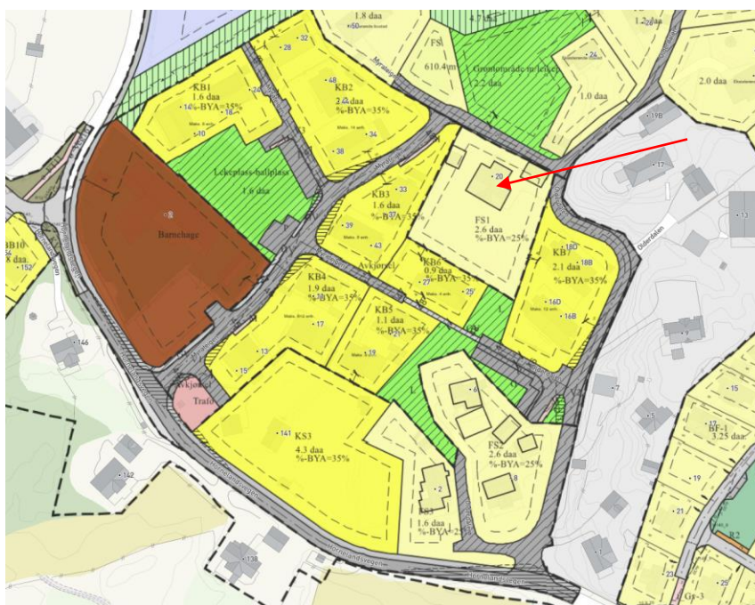
Utsnitt av reguleringsplan med PlanID R064-002.